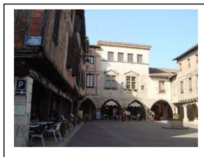
La place des arcades