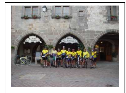
Juste avant le départ