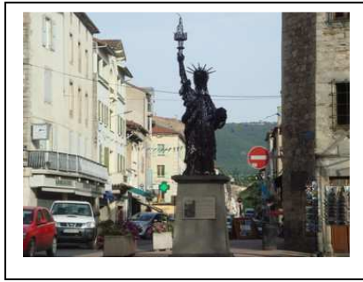
La statue de la Liberté