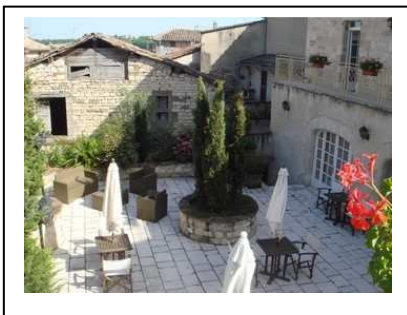
Cour intérieure de l'hôtel

s'impose architecture, maisons à colombages, un exemple de propreté, des maisons fleuries, et pour couronner le tout un panorama à 360°. Excellent accueil à l'hôtel des Consuls, tout comme à l'auberge des Arcades.