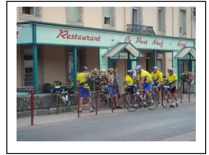
Prêts pour le départ