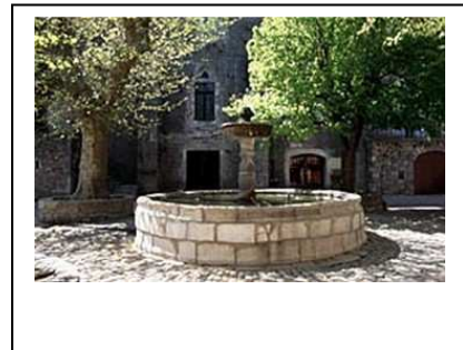
La fontaine de St Eulalie de Cernon