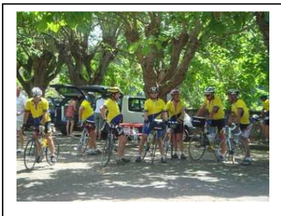
← Le pique nique

Nos compagnes de voyage nous attendent au bord du Tarn, à l'ombre des catalpas, pour un bon pique nique. Nous sommes à Reyniès. Un petit café avant de repartir (il faut bien faire valider nos cartes de route !) nous roulons dans la vallée beaucoup de maïs et de tournesol, la route est plutôt plate, mais c'est un court répit, retour dans les ascensions pour arriver à Castelnau de Montmiral charmant « village perché ». Après les ablutions indispensables et un moment de repos, une visite de l'accueillant village